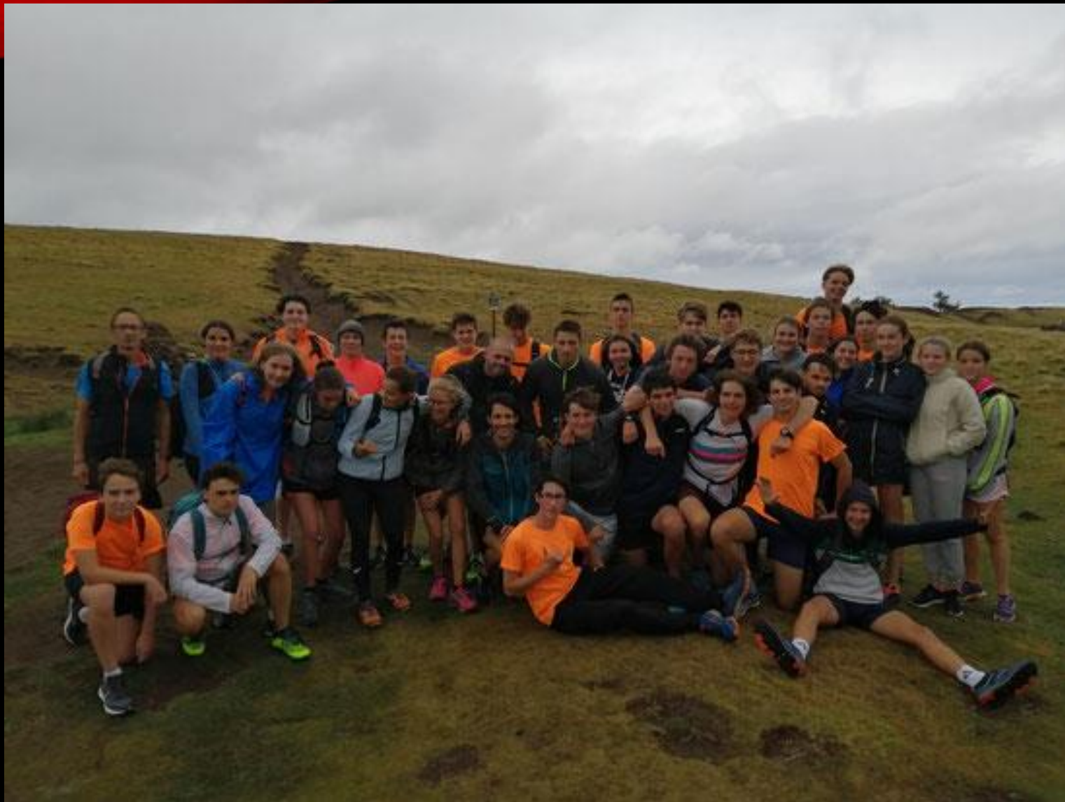
Ascension du Puy de Dôme avec l'ancien champion du monde de trail (2009) Thomas Lorblanchet