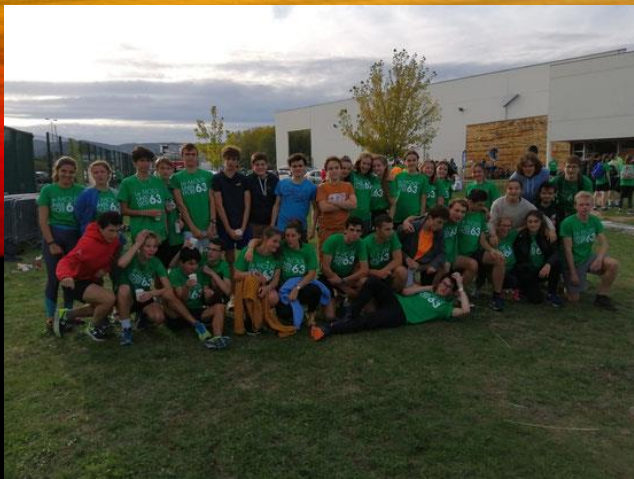
Mouv1 à Riom Raid multi-activités par équipe de 3