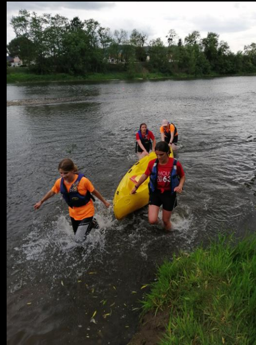
Mouv4 à Pont du Château Raid multi- activités par équipe de 4