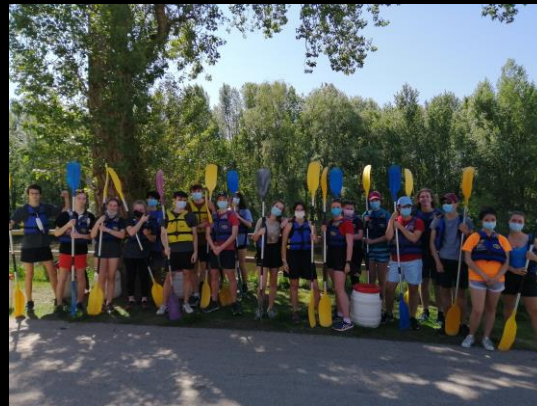
Sortie Canoe (Allier)