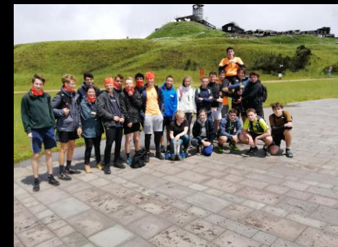
Trail des 5 puys